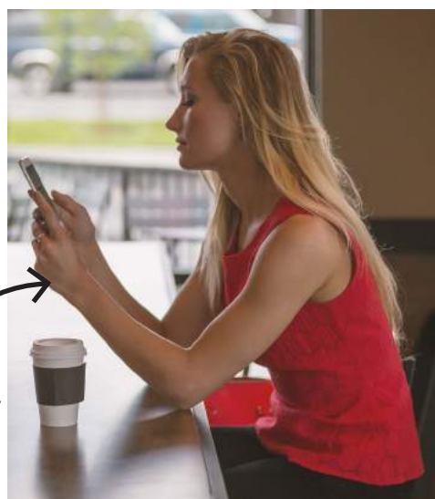
Dieses Jahr nur genervt am Handy

Überhaupt stellen sich die Alpakas als großes Problem heraus. Diese Viecher sind wirklich überall. Schon alleine deren Anwesenheit zerstört die ganze Alpenatmosphäre. Wenn ich Urlaub in den Alpen mache, will ich aus dem Fenster auf eine Kuh- oder Schafweide oder auch Pferdeweide aber auf gar keinen Fall auf eine Alpakaweide gucken.